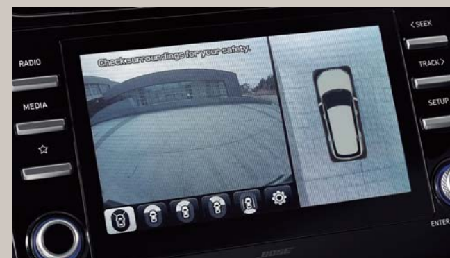
شاشة عرض محيطية (SVM)

عند تشغيل إشارات الانعطاف. يتم عرض صورة الجانب الخلفي للاتجاه المقابل على الشاشة.