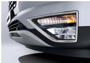
مصابيح ضباب أمامية (LED MFR)