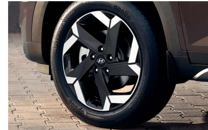
مصابيح أمامية LED مع مصابيح نهائية LED DRL عجلات معدنية بقصة الألماس مقاس 18 بوصة