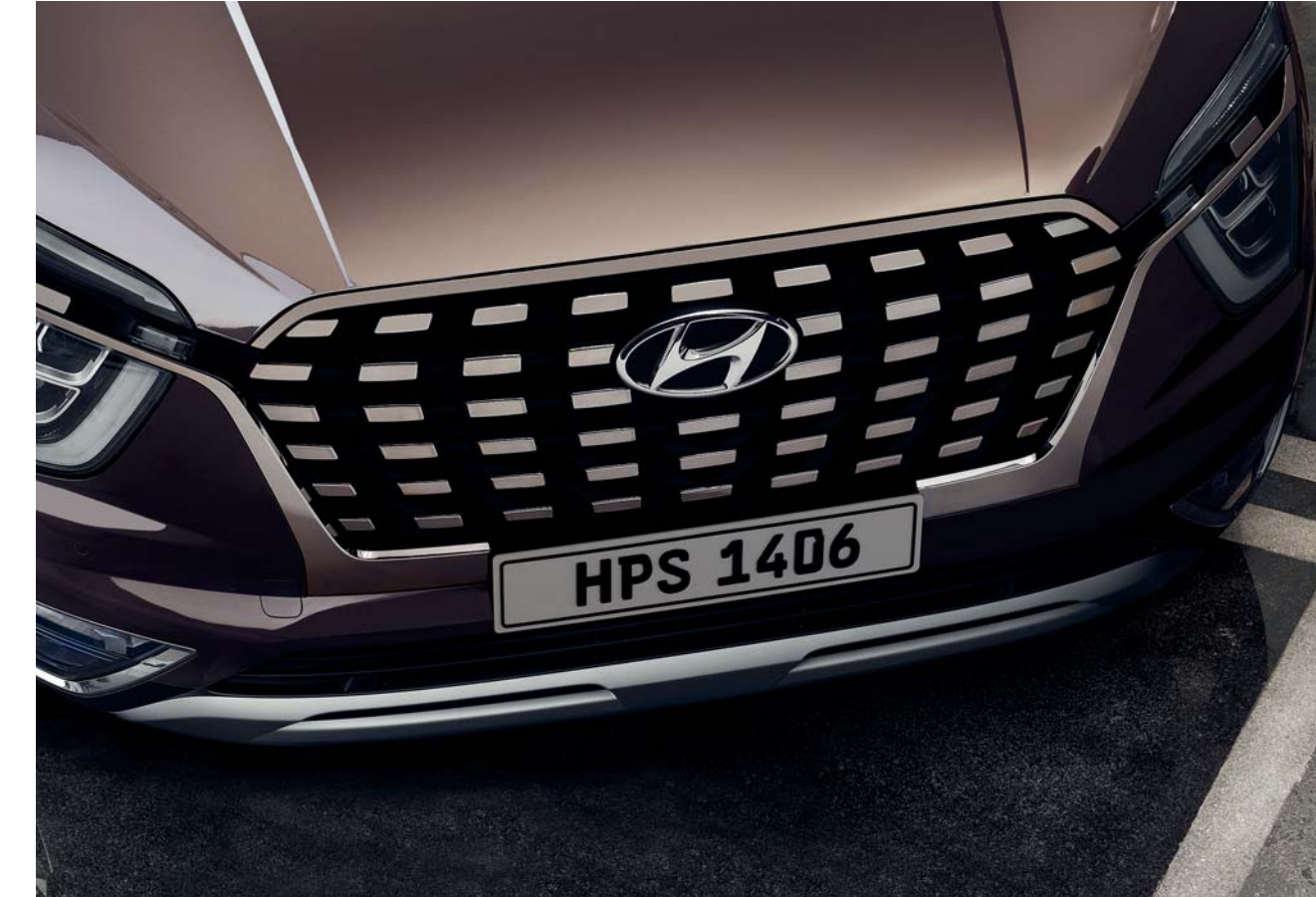
شبكة أمامي ذو شكل متقاطع خاص مطلي بالكروم