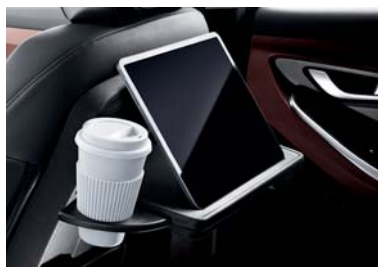
طاولة في ظهر المقاعد الأمامية مع حامل أكواب قابل للإغلاق وحامل جهاز لوجي