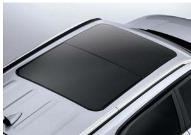
فتحة سقف بانورامية