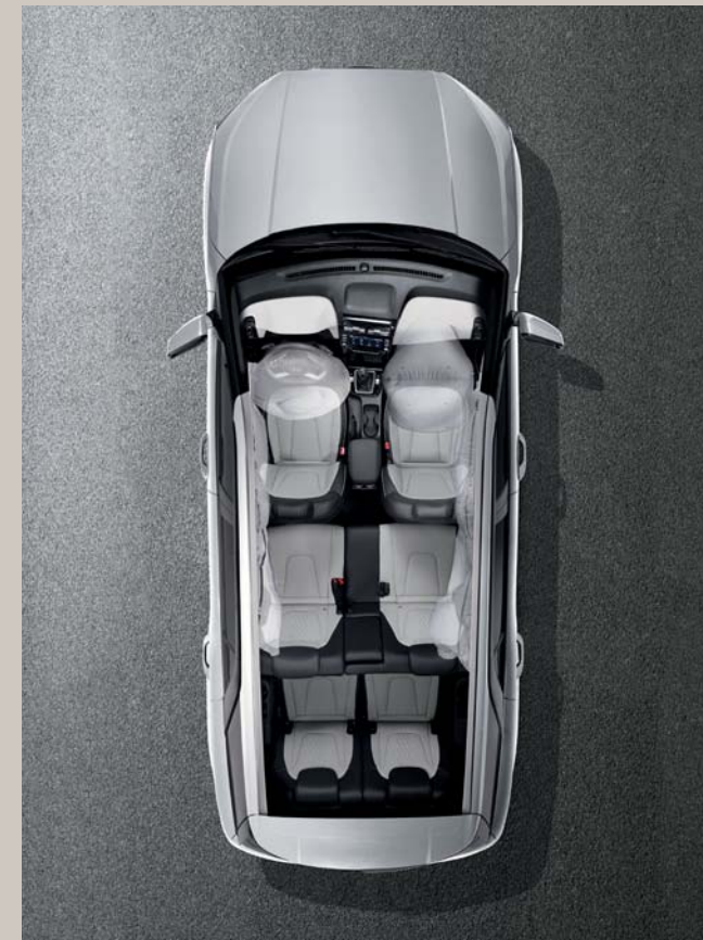
نظام من 6 وسائد هوائية (السائق، الراكب، وسادة هوائية جانبية وستارية)

يوفر نظام الكاميرا المتعددة مشاهدة محيطية 360 درجة حول السيارة. لمساعدة السائق أثناء ركن السيارة.