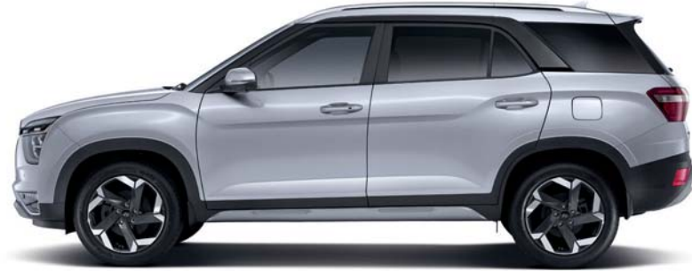
4,500 2,760 الطول الإجمالي قاعدة العجلات