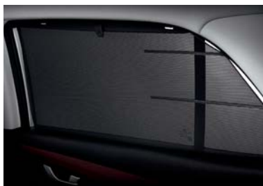
ستارة يدوية بالباب الخلفي