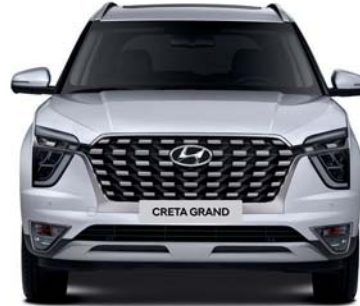
1,790 1,595.5 العرض الإجمالي مداس العجلات