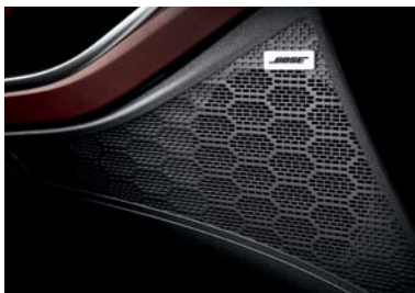
نظام صوتي راقى BOSE