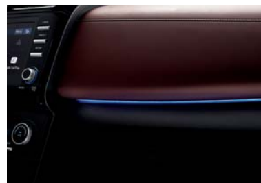
مصباح خافت بـ 64 لون