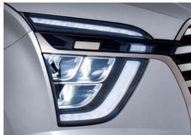
مصابيح أمامية MFR LED ومصابيح LED نهائية