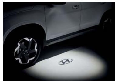
مصباح في المرأة الخارجية مع شعاع هينداي