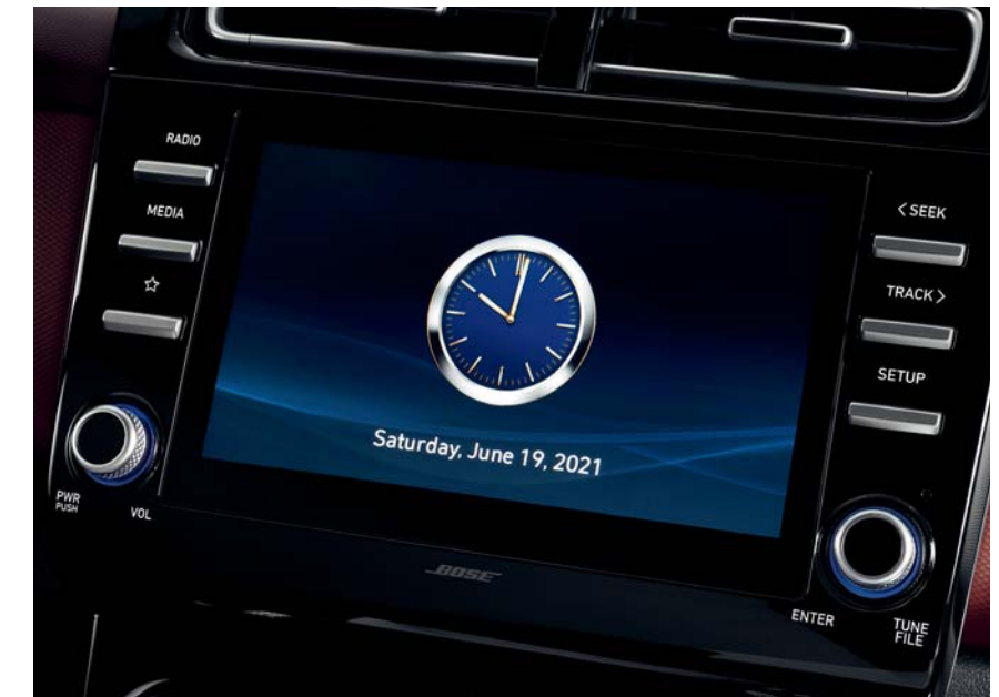
شاشة تعمل باللمس مقاس 8 بوصة