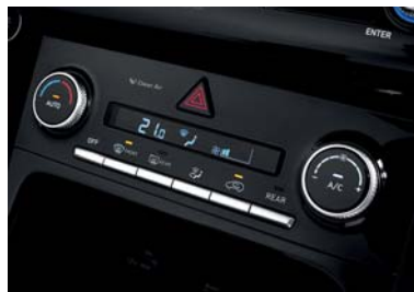
نظام تكييف هوائي أوتوماتيكي بالكامل