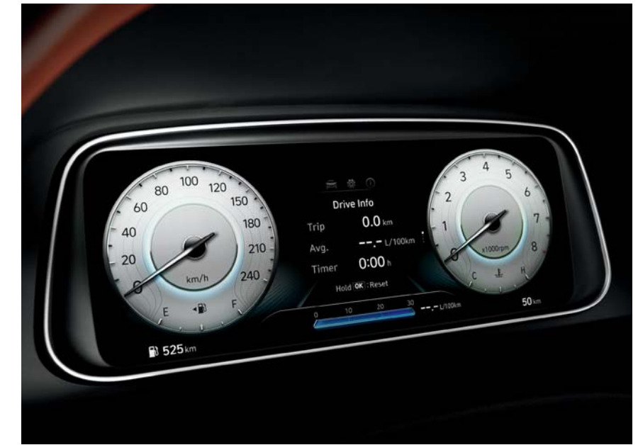
مجموعة عدادات LCD TFT مقاس 10.25 بوصة