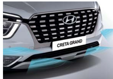
نظام تنبيه للمسافة الأمامية