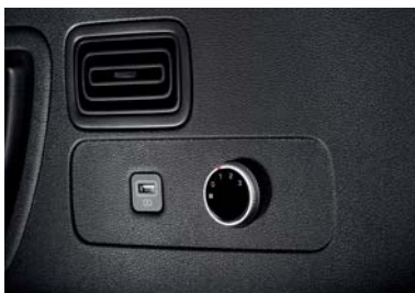
فتحات تهوية بالصف 3 وتحكم بالسرعة (3 مراحل)