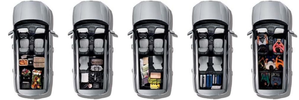
7 مقاعد مقاعد الصف الثالث مطوية مقاعد الصف الثاني مطوية بنسبة 40% مقاعد الصف الثالث مطوية مقاعد الصف الثاني مطوية بنسبة 60% مقاعد الصف الثاني مطوية والصف الثالث مطوية

كرينا جراند تفي بوعدها لتكون أكثر السيارات أناقة وجاذبية، فمقصورتها الفريدة تحيطك بكافة وسائل الأمان والراحة، وتتميز بلمسات فخمة وإضافات مدروسة وتفصيل دقيقة تمنحك بهجة خالصة وسعادة لا حدود لها. صُممت سيارة كرينا جراند لتلقت الأنظار وترك انطباع لا يمكن تجاهله كيفما تجولت، بدءاً من أليتها المبتكرة المستخدمة والمقاعد القابلة للتعديل وصولاً إلى المساحة الرحبة للمقصورة ذات اللونين والمقاعد الجلدية المثقبة التي تخلق جواً فاخراً.