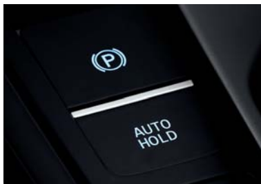
نظام كبح إلكتروني عند ركن السيارة مع توقف آلي