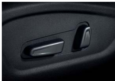
مقعد السائق بضبط كهربائي إلى 8 وضعيات