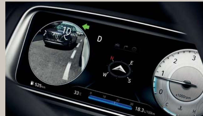
شاشة مراقبة المنطقة العمياء (BVM)

عند تشغيل إشارات الانعطاف. يتم عرض صورة الجانب الخلفي للاتجاه المقابل على الشاشة.