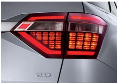
مجموعة مصابيح خلفية LED