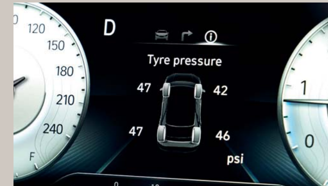
نظام مراقبة ضغط الإطارات (TPMS)

تتوفر في سيارات كريتا جرانند 6 وسائد هوائية، وسائد للسائق والراكب بالإضافة إلى وسادتين جانبيتين لحماية الصدر والحوض. بينما توفر الوسادتان الجانبيتان في اليمين واليسار حماية لرؤوس ركاب السيارة.