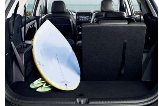
مساحة تخزين متعددة الاستخدامات

يعمل صندوق الكونسول الرئيسي متعدد الاستخدامات كمسند ذراع مبطّن وصندوق تخزين سهل الاستخدام ويتوفر مع شاحن هاتف لاسلكي وحاملات أكواب مزدوجة مدمجة.