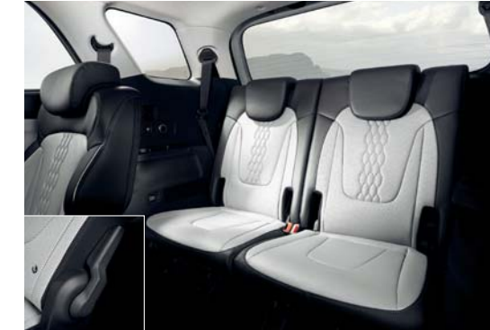
نظام طي مقاعد الصف الثاني ومقاعد الصف الثالث

ما عليك سوى ضغط الزر لتحريك مقاعد الصف الثاني إلى الأمام والخلف، أو طي مساند الظهر نحو الأسفل لتتيح لركاب الصف الثالث الدخول والخروج بسهولة.