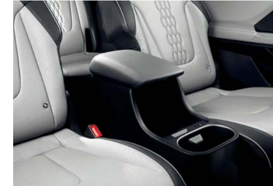
صندوق في كونسول الصف الثاني (6 مقاعد)

ما عليك سوى ضغط الزر لتحريك مقاعد الصف الثاني إلى الأمام والخلف، أو طي مساند الظهر نحو الأسفل لتتيح لركاب الصف الثالث الدخول والخروج بسهولة.