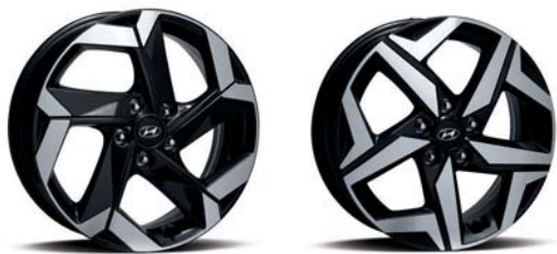
عجلات معدنية 18 بوصة