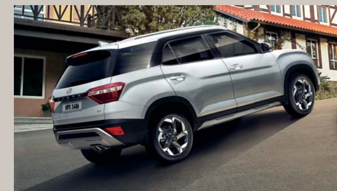
نظام تحكم للمساعدة عند المرتفعات

يساعدك نظام مراقبة ضغط الإطارات على تحقيق أفضل اقتصاد في استهلاك الوقود وإطالة عمر الإطارات من خلال تنبيهك عن حالة الإطارات وما إذا كانت بحاجة إلى معاينة أم لا.