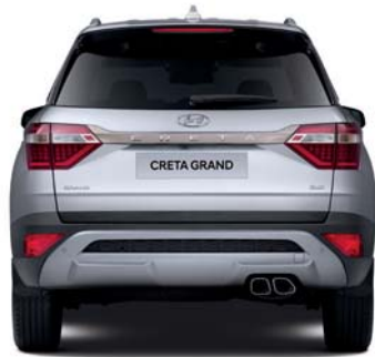
1,564.3 مداس العجلات